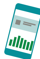
Övervakningsportal via internet