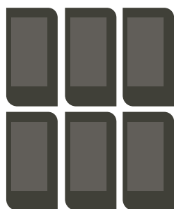
Solcellspannor ger likström