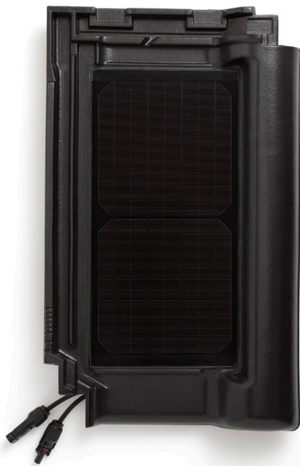
FINNS SOM SVART OCH NATURRÖD