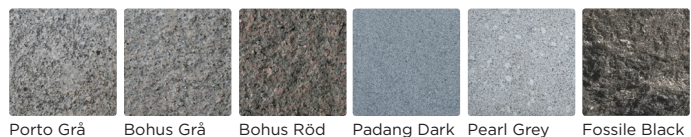
Porto Grå Bohus Grå Bohus Röd Padang Dark Pearl Grey Fossile Black